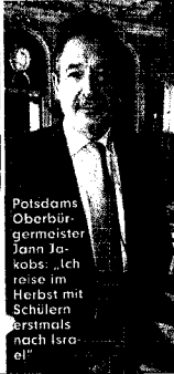
Potsdams Oberbürgermeister Jann Jakobs: „Ich reise im Herbst mit Schülern erstmals nach Israel.“